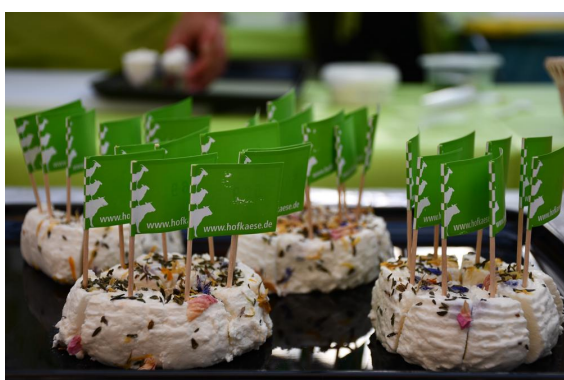
Milch- und Käseprüfung des VHM vom 2. - 4. September auf dem Deutschen Käsemarkt in Nieheim