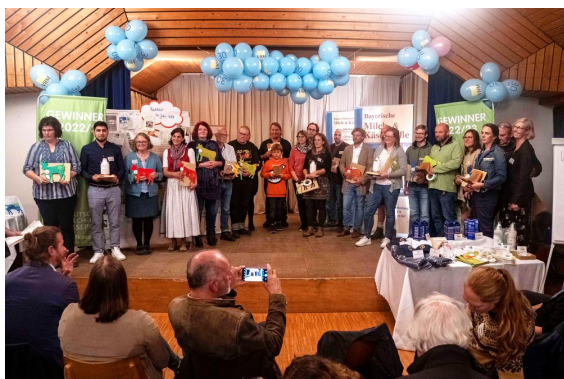
Preisverleihung auf dem Dottenfelderhof am 15.10.2022 in Bad Vilbel