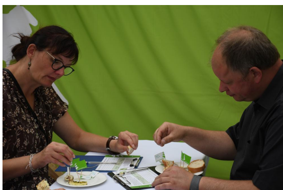
Beliebtheitsprüfung durch das Publikum vom 2. - 4. September auf dem Deutschen Käsemarkt in Nieheim