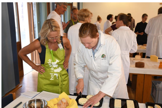
Qualitätsprüfung für den Milch- und Käsepreis vom 2. - 4. September auf dem Deutschen Käsemarkt in Nieheim